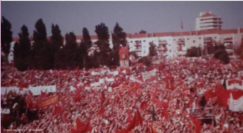
Frame de “Ano 1º - 1º de Maio”

Segunda sessão do ciclo de cinema temático de Aveiro 2024 – Capital Portuguesa da Cultura, com a estreia de “Experimenta Música”, um filme encomendado para este ano, e duas curtas-metragens históricas. A escolha destes projetos recai no tema deste trimestre, ‘Cultura e Democracia’, tendo como parceira a Cinemateca Portuguesa. O ciclo repete-se a cada trimestre com novos filmes associados aos respetivos temas.