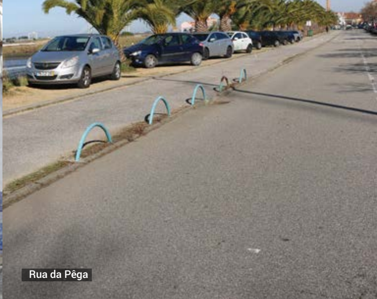
Rua da Pêga