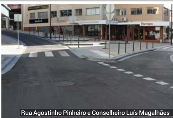
Rua Agostinho Pinheiro e Conselheiro Luís Magalhães