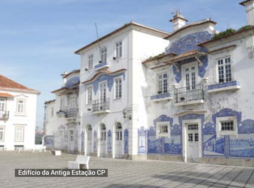
Edifício da Antiga Estação CP