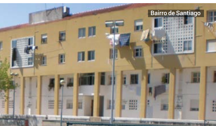
Bairro de Santiago

A qualificação global do parque dá continuidade ao investimento da Câmara Municipal de Aveiro no local, depois da realização de uma primeira intervenção de reabilitação da infraestrutura de iluminação pública em 2016 em parceria com a EDP, com o objetivo de melhorar as condições de segurança passiva existentes no local, reforçando a iluminação dos caminhos existentes, substituindo as colunas e luminárias danificadas.