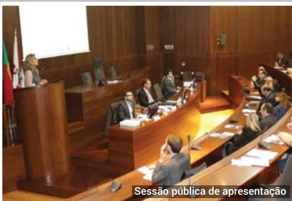
Sessão pública de apresentação