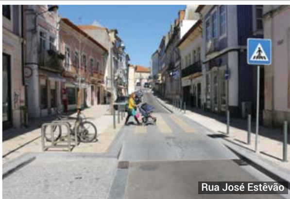
Rua José Estêvão