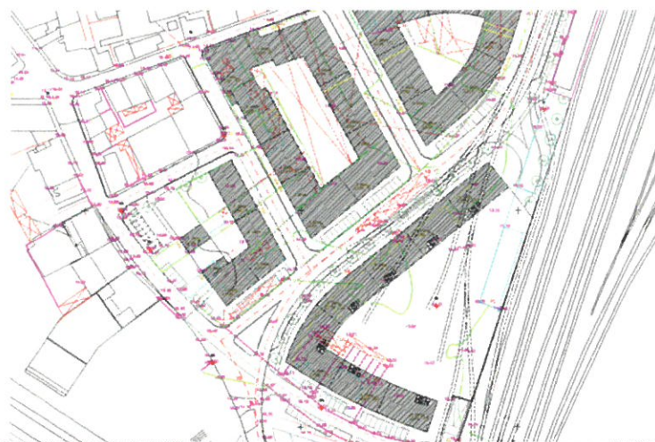
Figura 2: Extrato do "PP CP Sul".

Para o local existe um estudo unidade operativa n.º 17, denominado por "PP da CP Sul", aprovado em reunião de câmara em 20.07.2000, que tem sido orientador para os processos nesta área, propondo os novos alinhamentos e cêrceas máximas de 4 pisos.